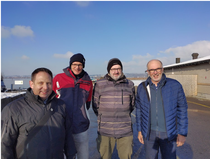
Die Prüflinge des schleusenverein.ch

In Lachen fanden dann die Theorieprüfung statt. Die Prüflinge konnten gleich anschliessend das Resultat erfahren.