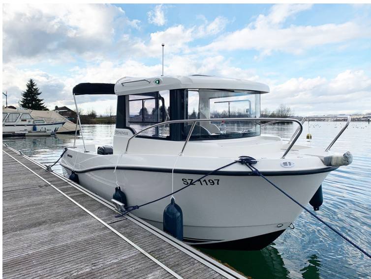
Übungs- und Prüfungsboot

Die Navigationsaufgaben sind etwas anspruchsvoller und wurden deshalb am Kurs ausführlich behandelt und besprochen. Dabei lernten wir Interessantes über unseren Planeten und die Dynamik des magnetischen Nordpols kennen. Wir wissen jetzt auch die Seekarten zu lesen und korrekt zu interpretieren, was auch in der Nacht zu zuverlässigen Peilungen führen soll.